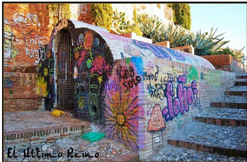
Aljibe del Zenete antes de ser limpiado