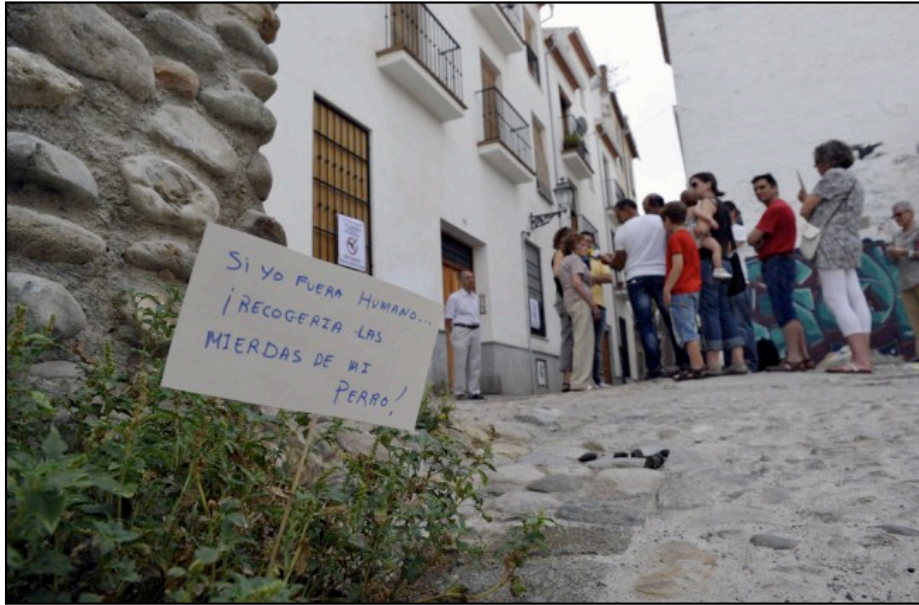
Excrementos de animales. Al fondo, una concentración vecinal