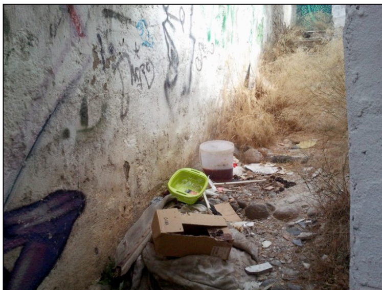
Restos de basuras en una de las calles del Albaicín