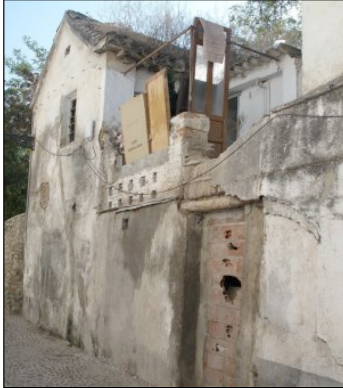
Una de las muchas casas abandonadas del Albaicín