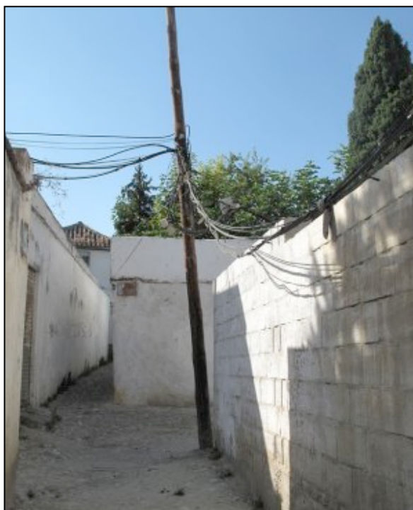
Cableado de la red eléctrica a la vista, cruzando el ancho de la calle